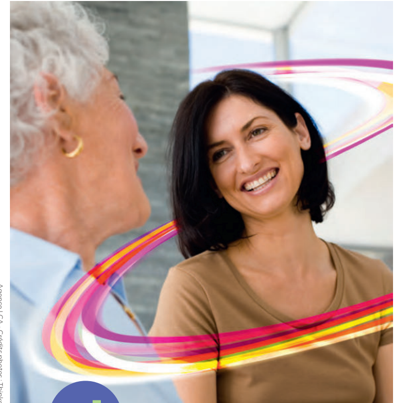
Agence LCA - Crédits photos: Thinkstock